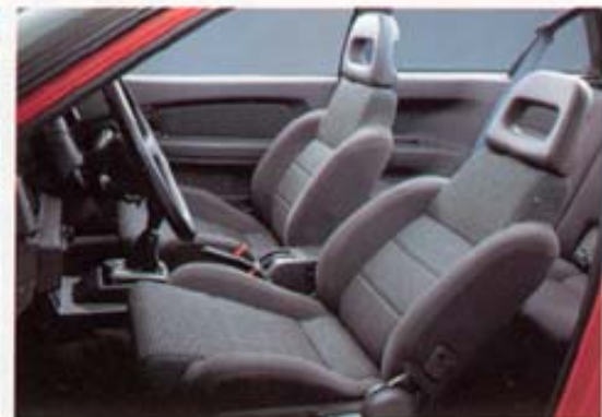
1800 GTi - 16V